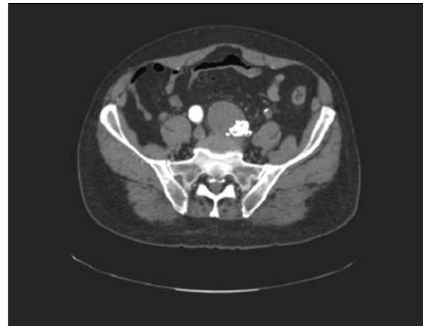
Figura 3. Aneurisma hipogástrico trombosado: ocluidor Amplatzer.